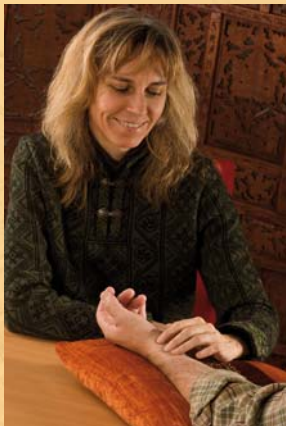
Pulsdiagnose eine wichtige Form der Diagnostik in der TCM

Damit entsteht eine individuelle, auf den Patienten speziell zugeschnittene Therapie.